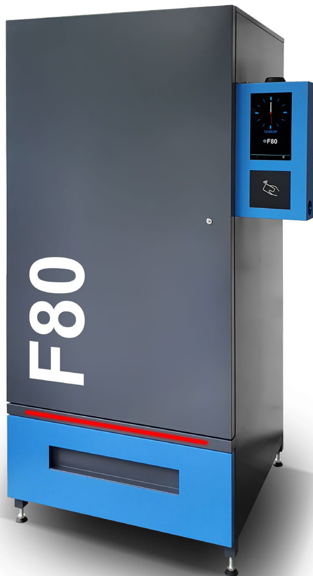
Automat dostępny w wersji BASIC oraz PRO

Imponującą ładowność urządzenia uzyskujemy dzięki możliwości zastosowania różnego rodzaju uzwojenia sprężyn, aż w 5 konfiguracjach ich skoku . Możliwość zamontowania do 8 półek, na każdej z nich dostępne 10 sprężyn, które można łączyć po dwie na większe produkty. Konfiguracja sprężyn jest nieograniczona, na jednej półce mogą być zainstalowane sprężyny pojedyncze i podwójne w różnych rozmiarach jednocześnie. Łatwa zmiana ustawień pozwala na każdorazowe dostosowanie pojemności automatu do aktualnych potrzeb eksploatacyjnych.