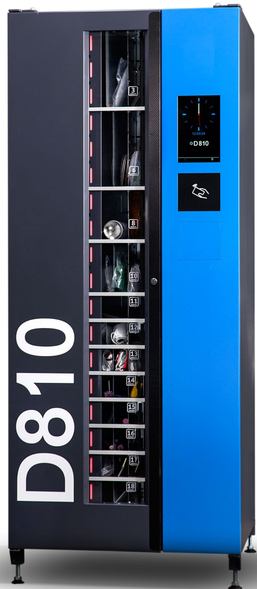
Automat dostępny w wersji BASIC oraz PRO

Imponującą ładowność urządzenia uzyskujemy dzięki funkcji regulacji komór na szerokość i wysokość, w 9 konfiguracjach . Półki mogą posiadać różną wielkość. Łatwa zmiana ustawień pozwala na każdorazowe dostosowanie pojemności automatu do aktualnych potrzeb eksploatacyjnych.