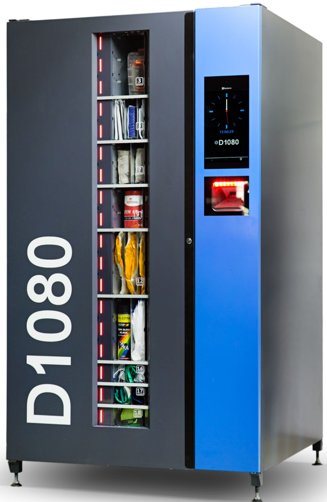
Automat dostępny w wersji BASIC oraz PRO

Imponującą ładowność urządzenia uzyskujemy dzięki funkcji regulacji komór na szerokość i wysokość, w 9 konfiguracjach . Półki mogą posiadać różną wielkość. Łatwa zmiana ustawień pozwala na każdorazowe dostosowanie pojemności automatu do aktualnych potrzeb eksploatacyjnych.