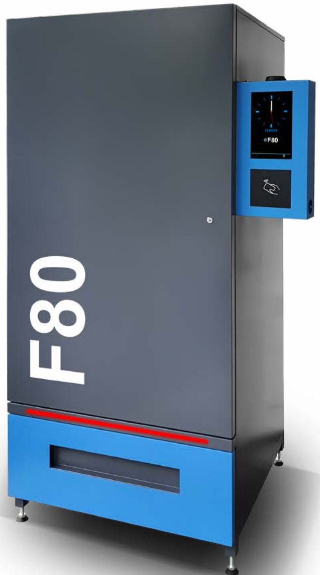
Automat dostępny w wersji BASIC oraz PRO

Imponującą ładowność urządzenia uzyskujemy dzięki możliwości zastosowania różnego rodzaju uzwojenia sprężyn, aż w 5 konfiguracjach ich skoku . Możliwość zamontowania do 8 półek, na każdej z nich dostępne 10 sprężyn, które można łączyć po dwie na większe produkty. Konfiguracja sprężyn jest nieograniczona, na jednej półce mogą być zainstalowane sprężyny pojedyncze i podwójne w różnych rozmiarach jednocześnie. Łatwa zmiana ustawień pozwala na każdorazowe dostosowanie pojemności automatu do aktualnych potrzeb eksploatacyjnych.