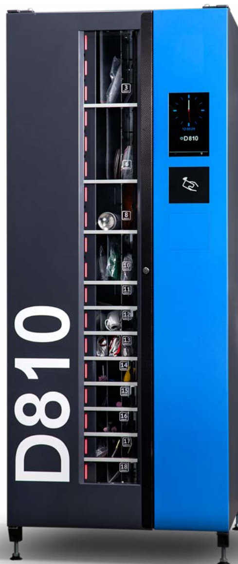
Automat dostępny w wersji BASIC oraz PRO

Imponującą ładowność urządzenia uzyskujemy dzięki funkcji regulacji komór na szerokość i wysokość, w 9 konfiguracjach . Półki mogą posiadać różną wielkość. Łatwa zmiana ustawień pozwala na każdorazowe dostosowanie pojemności automatu do aktualnych potrzeb eksploatacyjnych.