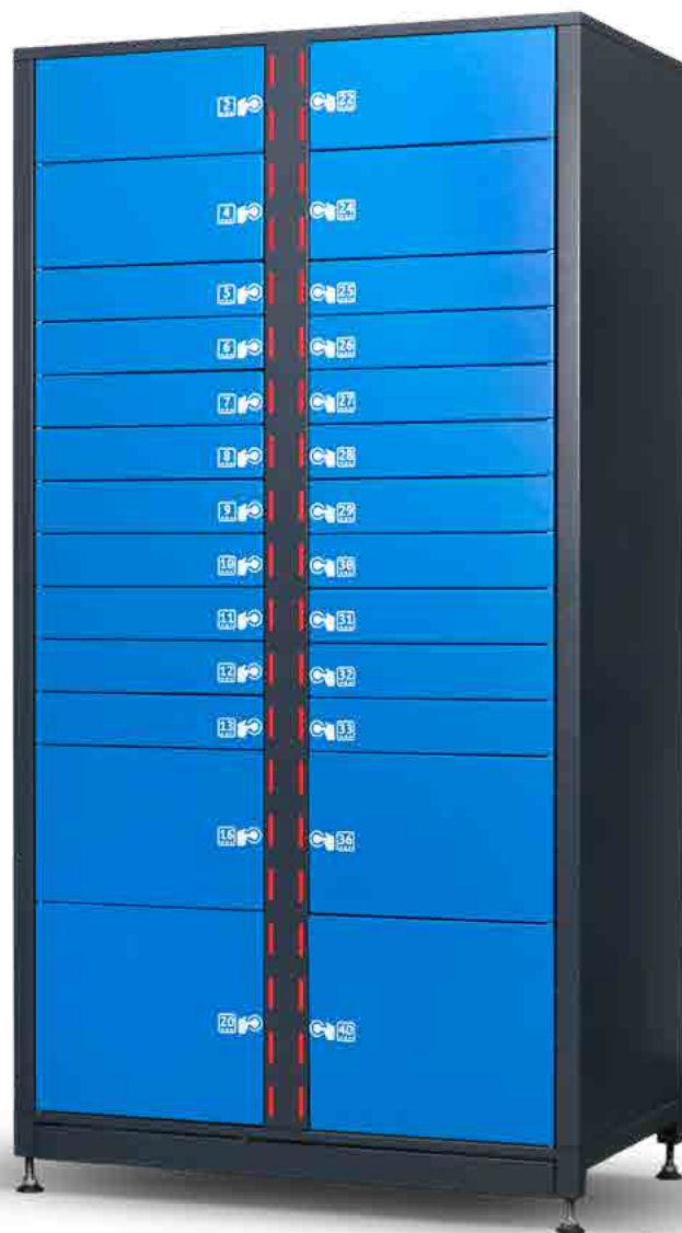
Automat dostępny w wersji z panelem użytkownika oraz bez panelu użytkownika

Dzięki funkcji regulacji półek – na wysokość , w 4 rozmiarach, do urządzenia można załadować nawet 40 produktów jednocześnie. Łatwa zmiana ustawień pozwala na każdorazowe dostosowanie pojemności automatu do aktualnych potrzeb eksploatacyjnych.