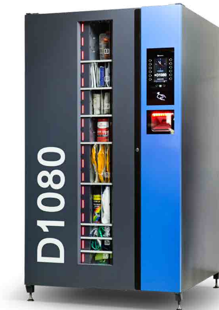
Automat dostępny w wersji z panelem użytkownika oraz bez panelu użytkownika

Imponującą ładowność urządzenia uzyskujemy dzięki funkcji regulacji komór na szerokość i wysokość, w 9 konfiguracjach . Półki mogą posiadać różną wielkość. Łatwa zmiana ustawień pozwala na każdorazowe dostosowanie pojemności automatu do aktualnych potrzeb eksploatacyjnych.